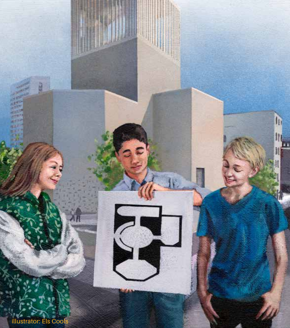
illustrator: Els Cools